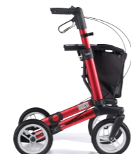
GEMINO 30 comfort