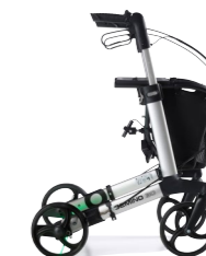
GEMINO 30 parkinson

Ultralehké designové chodítko. Mezi hlavní benefity patří skvělé funkce a nízká cena.