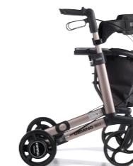
GEMINO 30 SpeedControl