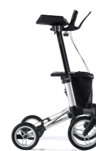
GEMINO 60 walker