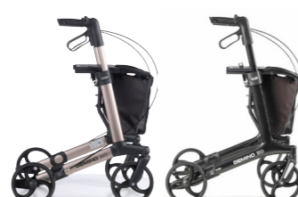
GEMINO 30 GEMINO 30 carbon