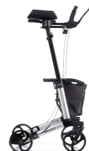
GEMINO 30 walker